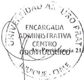
CHRISTIAN GRANDON HINOJOSA PHOTOMAT CHILE LTDA

Oficina 2183 - Of. 204 • Santiago • T/fax: 562 3348631-3348206 • gerencia@photomat.cl • www.photomat.cl