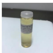
PVL (POLIVINIL LACTOFENOL)