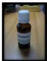
MEDIO DE ACLARADO