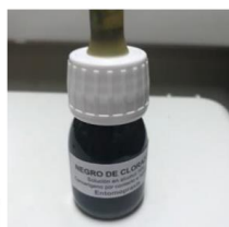
TINCIÓN CHLORAZOL BLACK