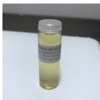
LIQUIDO DE HOYER